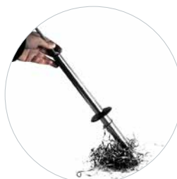
Option: Collecteur de copeaux magnétique Réf. 490153