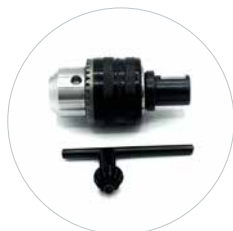
Option: Mandrin 13 mm avec adaptateur Weldon 19 mm Réf. 490152A