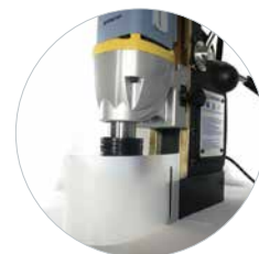
Inclus Protection contre la projection de copeaux