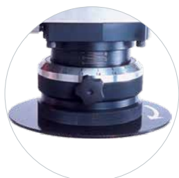
Réglable en hauteur sans outils Phase et mise à l'échelle réglable