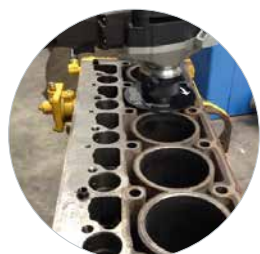
Ébavurage et chanfreinage polyvalent de contours, rayons et étroits trous, cordon de soudure 30° / 45° et préparation des bords visibles, etc.