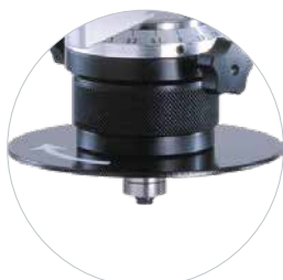
Réglable en hauteur sans outils Phase et mise à l'échelle réglables