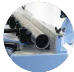
Bevestigingsset "K" voor buizen (art.nr. 600653)