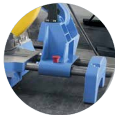
Disposition en 3 points Pour une position de sciage optimale

DEUX AMORTISSEURS DE VIBRATIONS GARANTISSENT UNE QUALITÉ DE COUPE ET UNE DURÉE DE VIE ÉLEVÉES