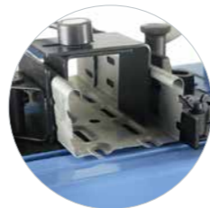
Système de serrage Thifix Pour les profils ouverts. En option (Réf 600546)