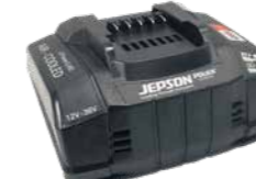
Air-cooled LiHD snellaadstation

Art.Nr. 230 V 608295EC2 Art.Nr. 110 V 608295EC1