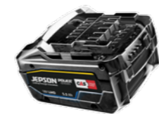
Krachtige batterij 18V LiHD 5.5A (CAS)