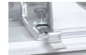
Adapter set (2 stk.)

Art.Nr. 230 V 608295EC2 Art.Nr. 110 V 608295EC1