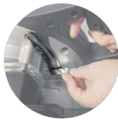
Diepte-instelling met schaal