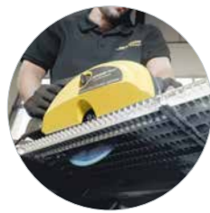
Ideaal voor het zagen van plaatwerk, roosters en sandwichpanelen tot 67 mm