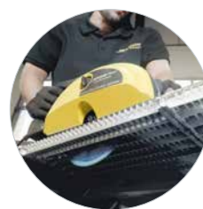
Idéal pour scier des tôles, des grilles et des panneaux sandwich jusqu'à 67 mm