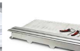
Jeu de rail de guidage Longueur 1.400 mm Serre-joints 2 pièces Réf. 608275SET