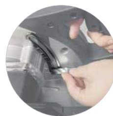
Réglage de la profondeur avec mise à l'échelle