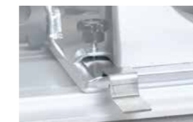
Jeu d'adaptateurs (2 pièces) Réf. 608275A