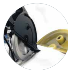
collecteur de copeaux