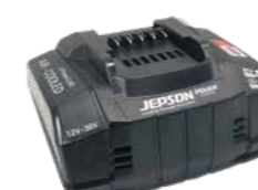
Air-cooled LiHD station de charge rapide Réf. 230 V 608295EC2 Réf. 110 V 608295EC1