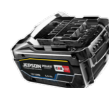
Batterie CAS Hautes performances 18V LiHD 5.5A Réf. 608295EB