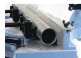
Bevestigingsset "K" voor buizen Ø 30 tot 70 mm Art.Nr. 600653