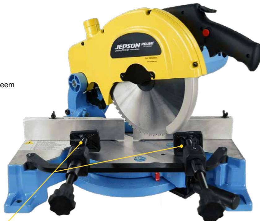
DUBBEL 3-TRAPS SNELSPANSTEEEM

Leveringsomvang: Ø 255 / 60T HM zaagblad voor ongelegeerd staal (dunwandig) + Bevestigingsset "K" voor buizen Ø 30 tot 70 mm