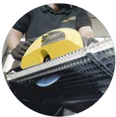
Ideal für Gitterroste mit LBS-Sägeblatt Art.: 608100LBS