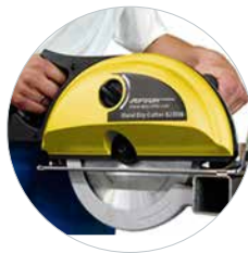
Mit einer Schnitttiefe bis zu 82 mm