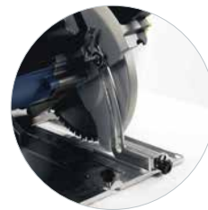
Tiefeneinstellung mit Skalierung