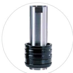
Optioneel: snelspanopname Art.: 490172