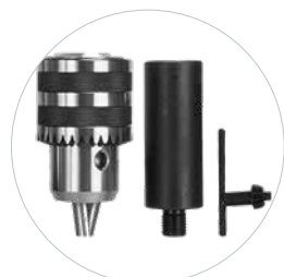
Optioneel: 16 mm boorkop en adapter Art. 490173