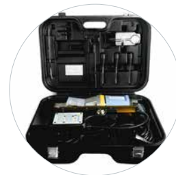
Lieferung im Koffer