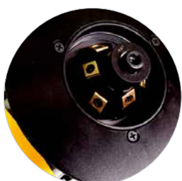
Incl. 45° gereedschapsopname