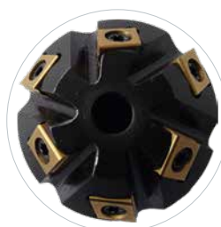
Ontbramen en afkanten van rondingen en gaten afschuiven van laskanten begint bij Ø 30 mm