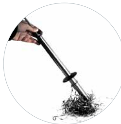
Option: Collecteur de copeaux magnétique Réf. 490153