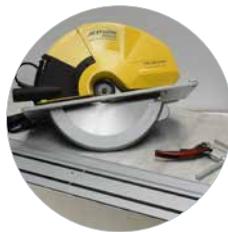
SHDC met geleiderailset