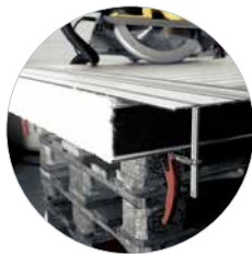
Geleiderail 1.400 mm met 2 snelspanklemmen