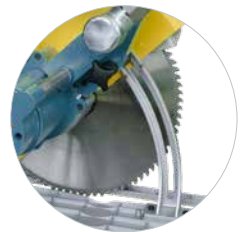
Diepteverstelling met schaalverdeling