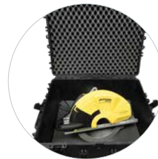
Incl. Transportkoffer met wielen