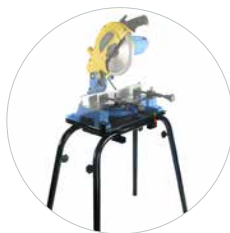
Optionaler Montageständer Art.-Nr. 600599