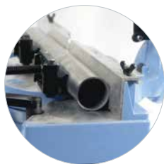
Inkl. Fixierungsset „K“ für Rohre Art.-Nr. 600653

Bestens geeignet für Profi-Arbeiten im Bereich: Interieur, Exterieur, Küchenbau, Heizung, Klima, Sanitär etc.