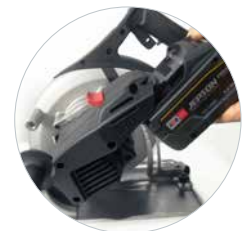
CAS - Systeem