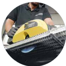
Ideaal voor het zagen van plaatwerk, roosters en sandwichpanelen tot 67 mm