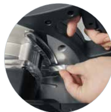
Diepte-instelling met schaal