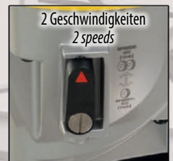
2 Geschwindigkeiten 2 speeds