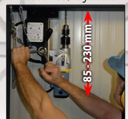
Großer Hub / huge stroke