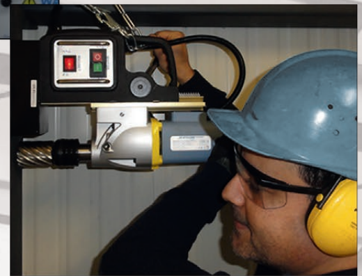
Höhenunterschiede sind leicht zu bewältigen