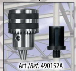
optional: 13 mm chuck with adapter to be mounted directly in quick release

Optional: 13 mm Bohrfutter & Adapter für den direkten Einsatz im Schnellspannfutter